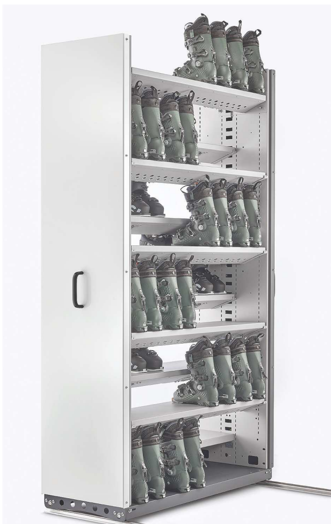
Modèle présenté : K-DRY-120L + façade K-PANEL-530LF